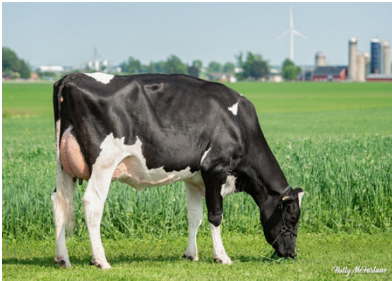
LIBERTY-GEN APPLEFRITTER DAUGHTER