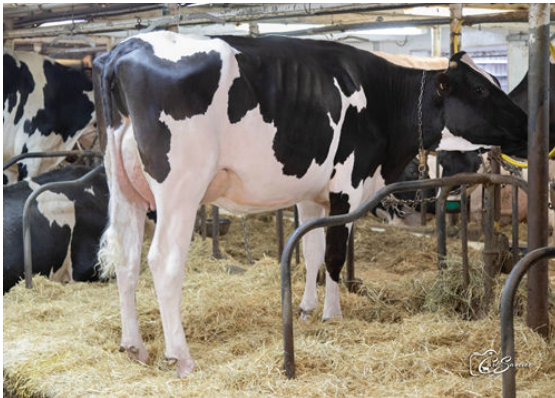
CLOVIS ALLEYOOP INDIANA DAUGHTER